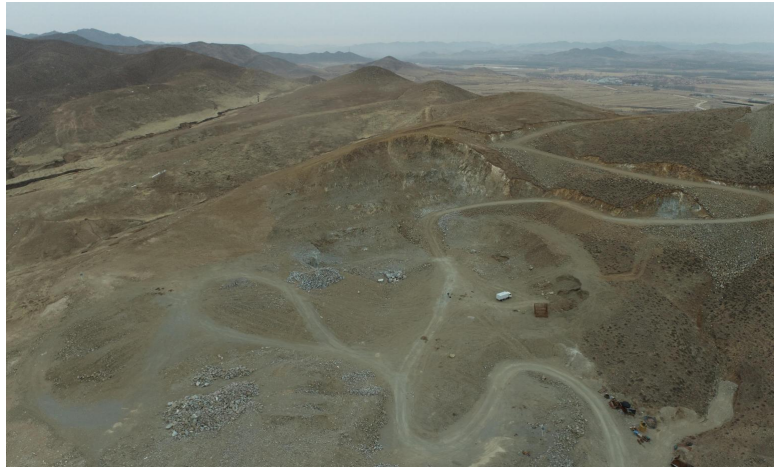
照片 4-1 露天采场