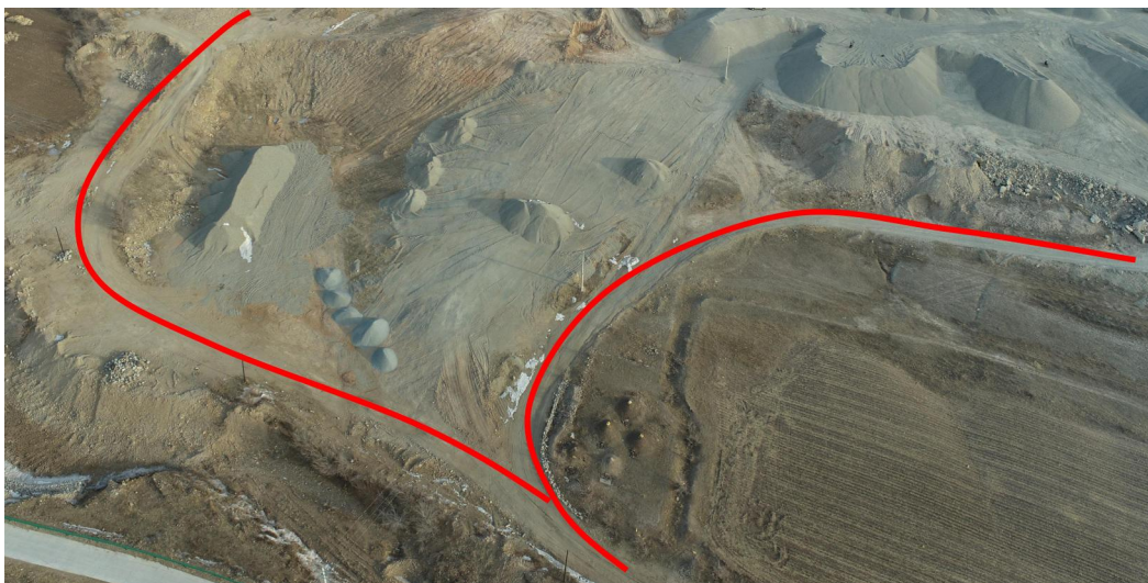
照片 4-4 矿区道路

连接各个单元与外界的道路，道路长 1088m，宽度 3-4m，矿区道路占地面积 4333m 2 。机械运输碾压地表，破坏地表植被，局部道路一侧形成 0.5m 高切坡，降低了地形地貌景观整体的和谐度，影响破坏原生地形地貌景观