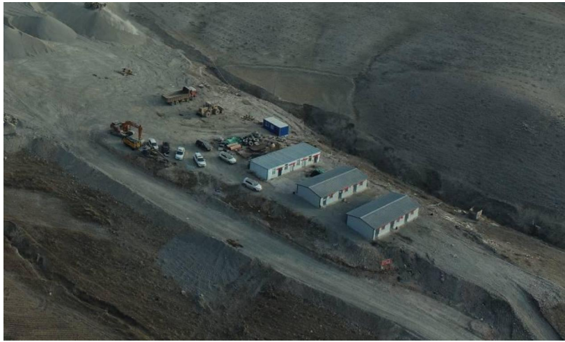
照片 4-3 办公生活区