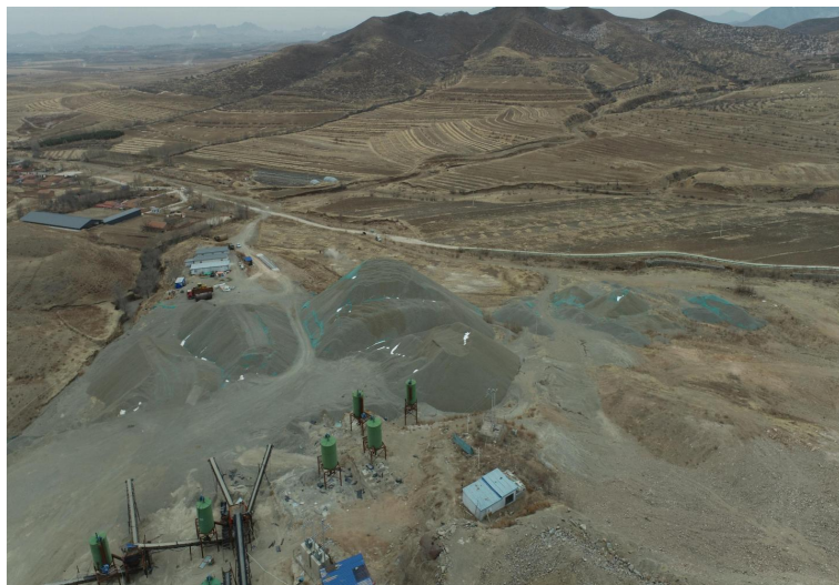
照片 4-2 工业场地

工业场地位于露天采坑南部，占地面积 23071\text{m}^2 ，为石料加工堆放场地，安放有机械加工设备，生产石料就地堆积在场内。场地建设破坏地表植被，影响改变了原生地形地貌景观。